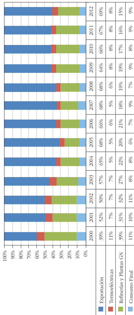
Gráfico 3 Destino de la producción de Hidrocarburos (porcentajes)