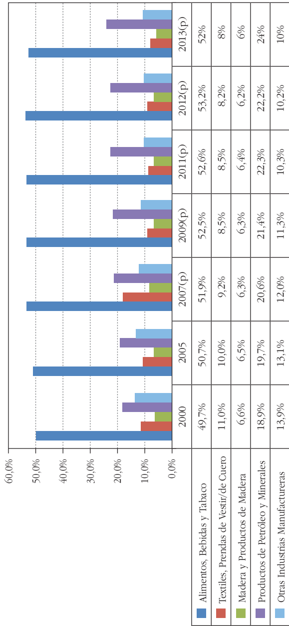
Gráfico 2 Estructura del PIB industrial (porcentajes)