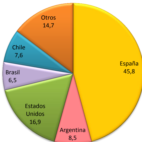
Gráfico 2 Remesas de Trabajadores Según País de Origen A septiembre de 2014 (En porcentajes)

Fuente: Sistema Financiero y otros participantes del mercado de remesas Elaboración: BCB