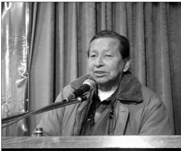
Pedro Mariobo, viceministro de Minería y Metalurgia durante su exposición en el foro debate.

la regalía con el IUE? El Impuesto a las Utilidades se calcula sobre la base imponible de los resultados, pérdidas y ganancias, es decir, sale de los balances. Pero ¿cuántos balances hacen las empresas privadas? Se realizan tres balances: uno para los socios, otro para el Estado y un tercero para la bolsa de valores. El balance para los socios es el real con el fin de dividirse las utilidades, el que es para el Estado es completamente falso y sirve para evadir los impuestos y el último es “inflado” para vender las acciones a mayor precio en el mercado internacional o en la bolsa de valores. De ahí resultan las llamadas “burbujas financieras”.