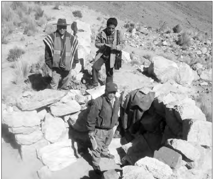
Pobladores de la región de Poopó evalúan las condiciones de agua potable en la región.

la minería mediana están en manos de los extranjeros.