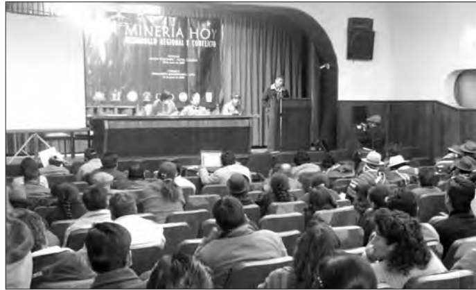
Más de 200 personas participaron del foro debate sobre minería en Oruro.

Asimismo, la pobreza hace de la política de “responsabilidad social” de la empresa un mecanismo de legitimación a partir de mínimos gastos sociales que al