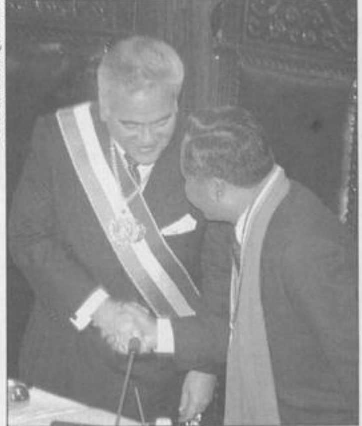
Gonzalo Sánchez de Lozada y Víctor Hugo Cárdenas, autores de la entrega de los hidrocarburos.

Entonces, casi lo único que buscó Sánchez de Lozada durante su segundo gobierno fue tratar de firmar el contrato para que las transnacionales