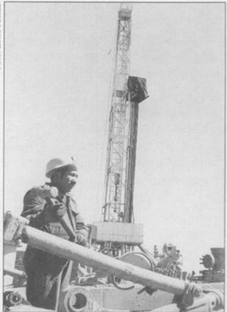
Trabajador de YPFB en una planta antigua.