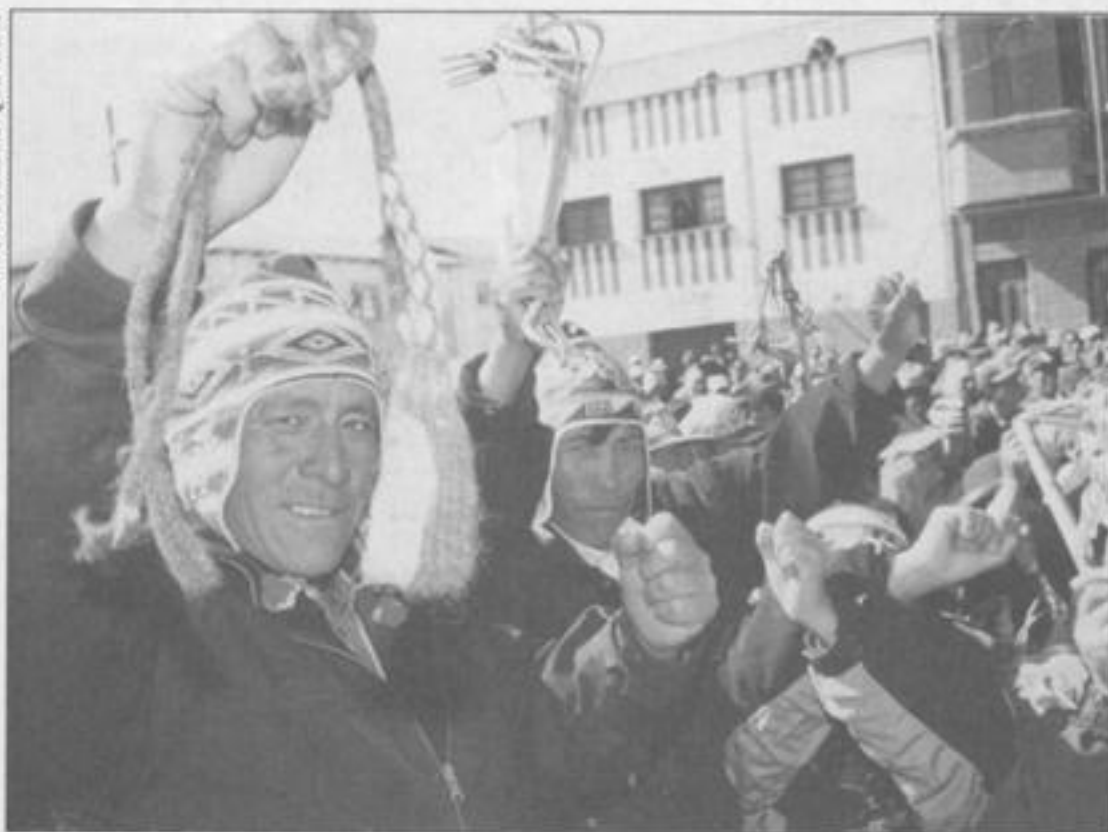
Warisata: Comunarios reunidos después de la masacre de septiembre de 2003.