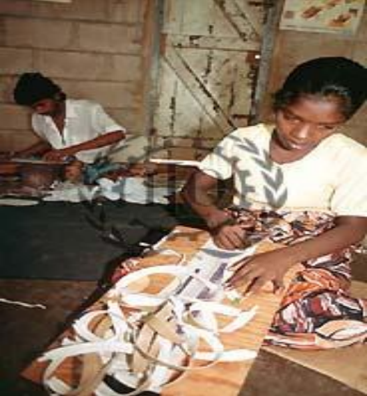
Trabajadoras a domicilio