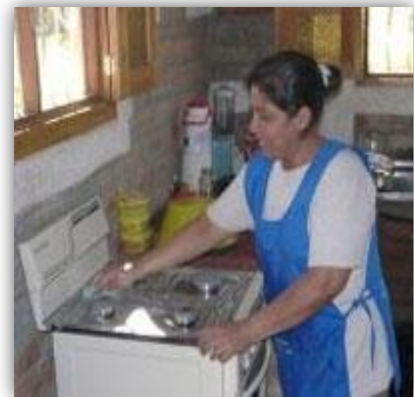
Trabajadoras del Hogar Remuneradas