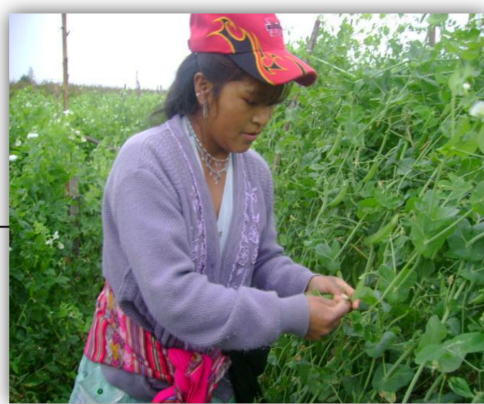
Trabajadoras Agrícolas Temporales